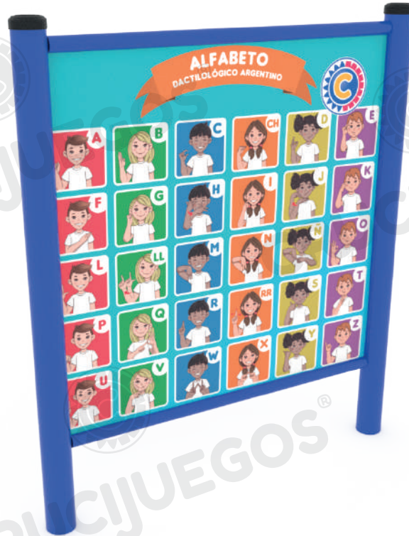
Imagen referencial. Para más información ingrese a www.insumos.crucijuegos.com